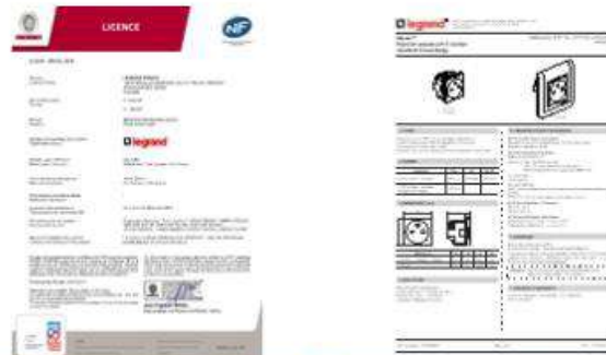
Certificat de Marque de Conformité